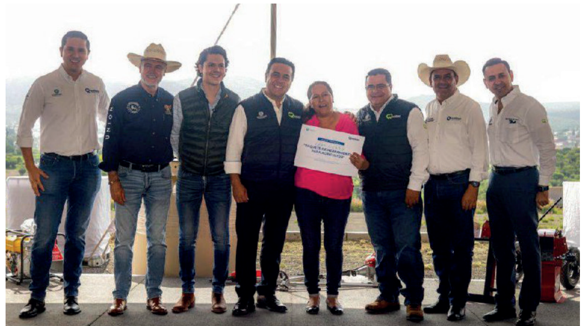
Evento: Esta iniciativa representó una inversión total de 1.5 millones de pesos.

Con estas herramientas y equipos, se busca mejorar las condiciones de trabajo y producción de los beneficiarios, fomentando la sostenibilidad.