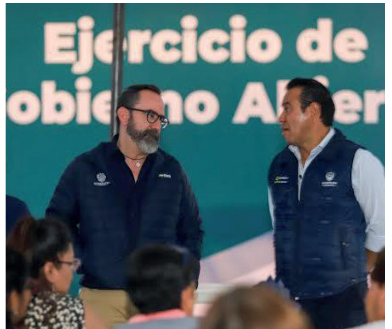
Evento: Habitantes de la capital decidieron 11 obras en sus mediante votaciones.

En el actual ayuntamiento se modificó el reglamento de participación ciudadana, con lo que los ejercicios de gobierno abierto seguirán en las siguientes administraciones, en temas como obras públicas y servicios municipales.