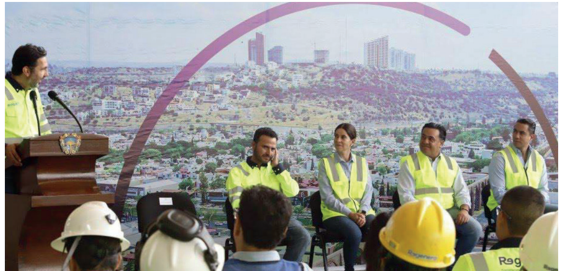
Evento: Esta iniciativa busca reducir significativamente la generación de desechos.

Ambos reconocieron el trabajo que está realizando Broquers Ambiental, bajo la dirección de CEMEX, en materia de manejo de residuos urbanos en la