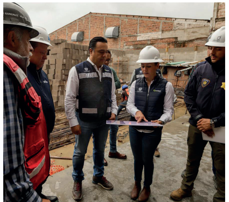
Evento: La Subcomandancia del centro histórico presenta un avance del 61%.

Finalmente, la secretaria puntualizó que en lo que va de la actual administración han sido destinados 545 millones de pesos en diferentes obras de seguridad, como subcomandancias.