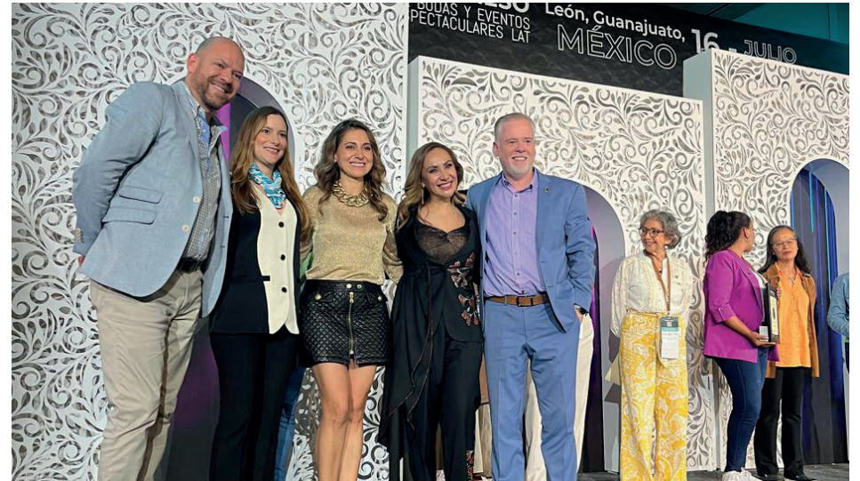
Evento: Querétaro recibe cerca de 100 bodas al mes.