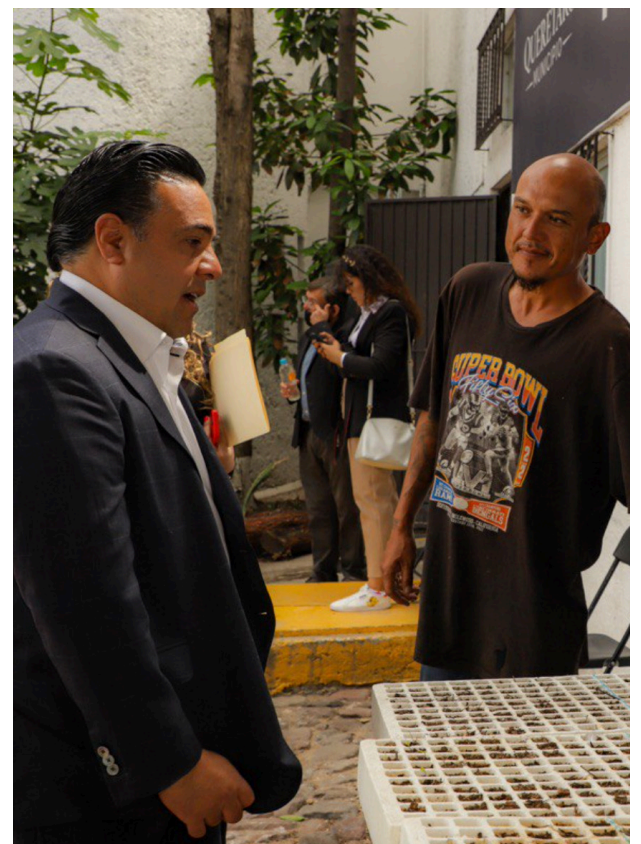
Se les brinda atención médica y psicológica en el inmueble