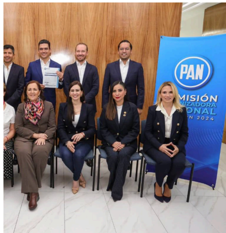
Buscarán convertir al pan en una oposición responsable

A partir del 26 de septiembre, comenzarán su campaña de acercamiento, escucha y propuestas dirigidas a los militantes panistas en todo el país.