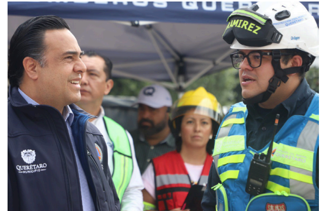
En el proyecto fueron invertidos 37 millones de pesos

También, se les renovó equipo y herramientas para la atención de urgencias, favoreciendo siempre la operatividad de sus elementos en favor de la seguridad de los habitantes.