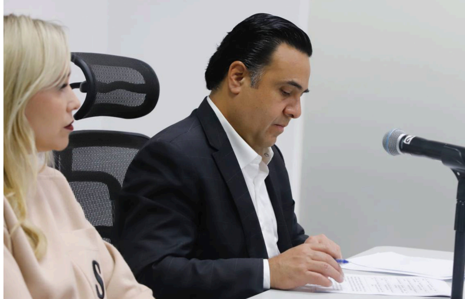
El edil se destacó que se deja un municipio sin préstamos activos

Asimismo, recordó que solo quedarán obras pendientes por concluir y que serán pagadas por la siguiente administración, pero con recursos reservados y etiquetados por el gobierno saliente.