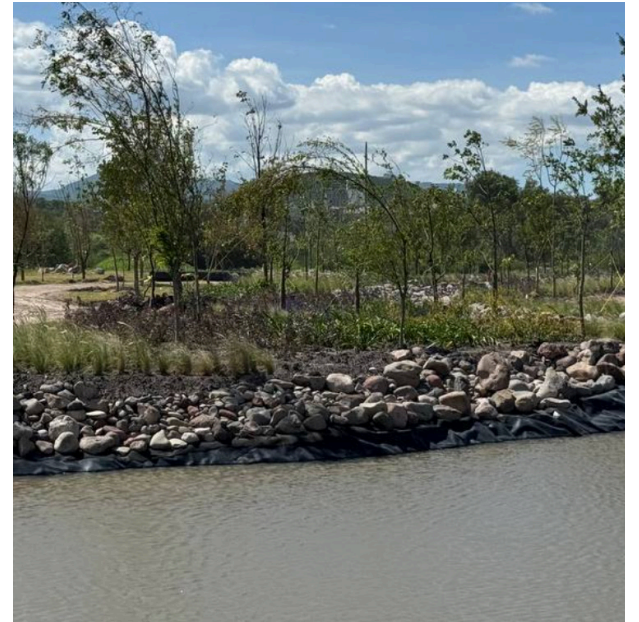
Cuenta con vasos reguladores de agua para evitar inundaciones

Tiene la intención de ser un pulmón verde para la ciudad, promover la biodiversidad y ofrecer un espacio natural para