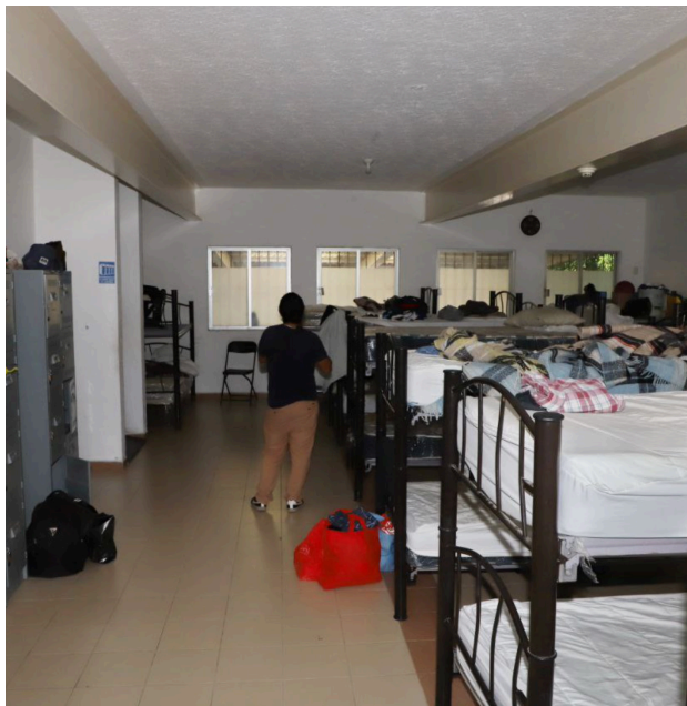
187 personas se han reintegrado a la sociedad, y 204 a la vida laboral

Se denomina “hogar de transición” ya que el programa de atención y reincorporación de las personas en situación de calle tiene una duración limitada de tiempo, y que va relacionado con la severidad y diagnóstico de cada persona, así como los objetivos del plan de tratamiento.