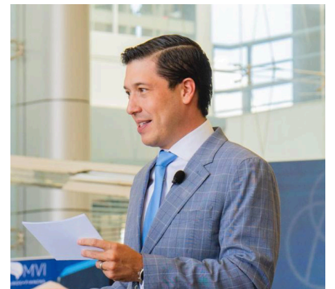
Fueron desechadas las impugnaciones de morena

Con esto, y habiendo agotado todas las instancias judiciales locales y federales, quedó confirmado el triunfo del PAN y la