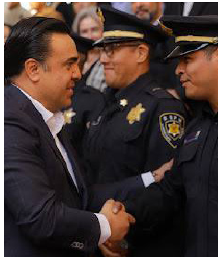
El municipio invirtió más de 545.9 millones de pesos en proyectos de infraestructura

El Municipio de Querétaro es considerado un referente en materia de seguridad a nivel nacional, pues en la última Mesa de Coordinación Regional para la Construcción de la Paz, fue reconocido por sus prácticas en materia preventiva.