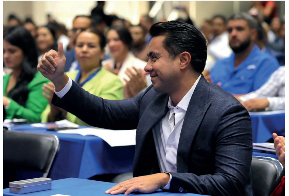
Evento: La reestructuración en el ayuntamiento favorecerá para atender las demandas de los ciudadanos.

Finalmente, el alcalde electo refirió que el municipio seguirá priorizando el manejo de finanzas sanas, y adelantó que no habrá ningún incremento en el gasto para pago de salarios ni para aumento de personal.