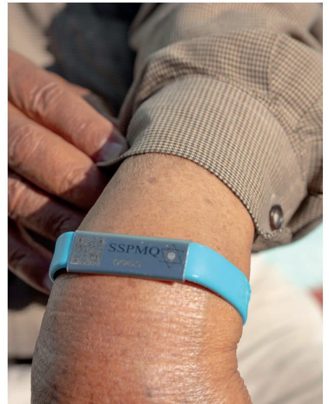
Evento: El proyecto, que nació en la capital, fue replicado en El Marqués y Corregidora.