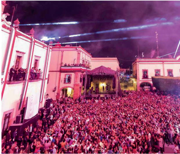
Evento: Más de 5 mil personas se reunieron en plaza de armas para dar el grito.

El gobernador de Querétaro, Mauricio Kuri González, conmemoró el 214 aniversario de la Independencia de México, en una ceremonia del grito de independencia celebrada en Plaza de armas,