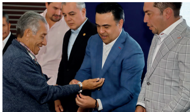
Evento: Los adultos mayores han podido reencontrarse con sus familias.

“De la Mano por tu Seguridad” ha entregado más de mil 700 brazaletes y se han atendido a más de 120 personas adultas mayores, todos los casos de manera satisfactoria, identificando a la persona y localizando a su familia de manera inmediata.