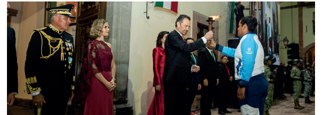
Evento: Mauricio Kuri recibió a los atletas de la “Carrera de la Conspiración de 1810”

Durante la ceremonia cívica, Kuri González en compañía de representantes de los Poderes Legislativo y Judicial, su familia e invitados especiales, quienes presenciaron el espectáculo de video mapping, luces y show piromusical, el cual también disfrutaron más de 14 mil espectadores que se reunieron en el Jardín Zenea y Plaza de Armas.