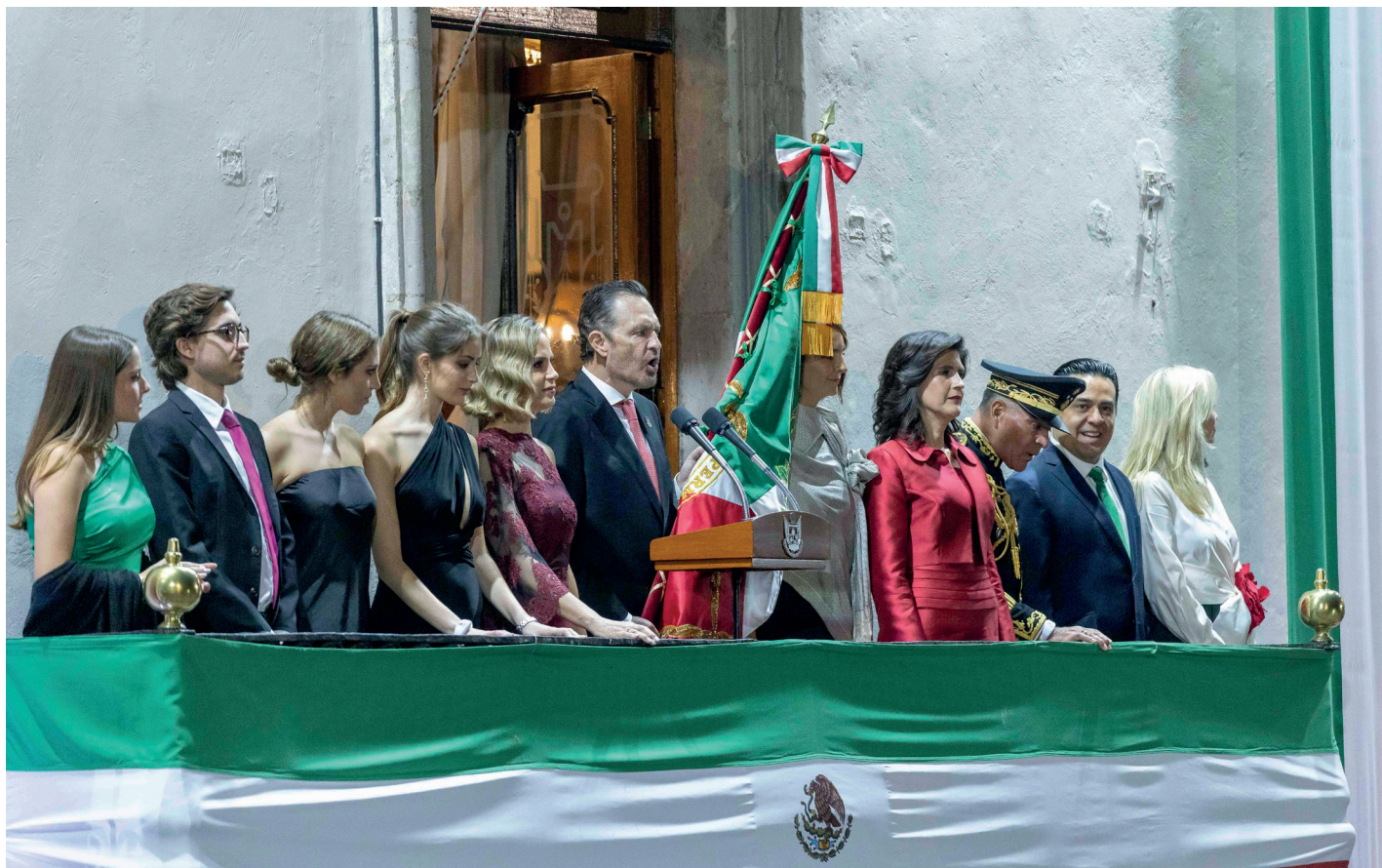
Evento: El mandatario estuvo acompañado de representantes de los poderes legislativo y judicial.

El gobernador de Querétaro, Mauricio Kuri González, conmemoró el 214 aniversario de la Independencia de México, en una ceremonia del grito de independencia celebrada en Plaza de armas, ante la presencia de más de cinco mil personas que se congregaron en el lugar.