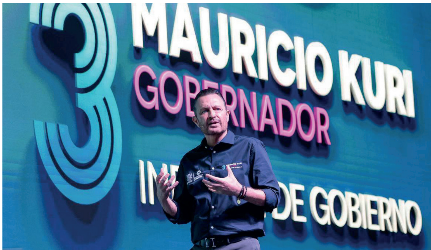
Evento: El mandatario estatal rindió su tercer informe de gobierno.

El gobernador del estado, Mauricio Kuri González, rindió su tercer informe de gobierno en el centro de congresos, donde destacó los ejes de movilidad, agua, infraestructura, economía familiar y acciones sociales.