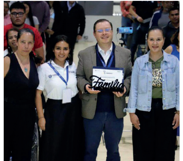
Evento: Busca fortalecer los lazos familiares como base de una sociedad unida.