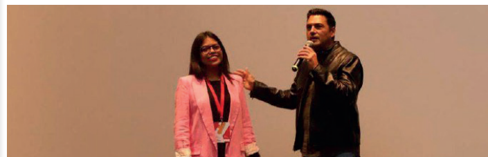
Evento: El documental es una nueva forma de comunicar políticas públicas a través del cine.

En el marco del Hay Festival Querétaro 2024, se proyectó el documental "Somos el Barrio", que ofrece un enfoque innovador en la comunicación de políticas públicas, mostrando cómo el arte puede ser una herramienta efectiva para inspirar el cambio social y mejorar la calidad de vida.