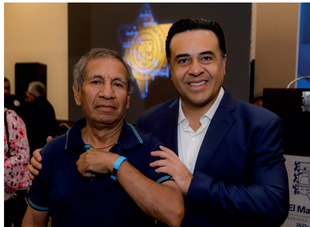
Evento: La percepción de seguridad en Querétaro está por encima de la media nacional.

El presidente Municipal de Querétaro, Luis Nava, reiteró que no bajará la guardia y junto con todas y todos los integrantes de la Secretaría de Seguridad Pública Municipal, trabajarán hasta el final por la tranquilidad de las familias queretanas.