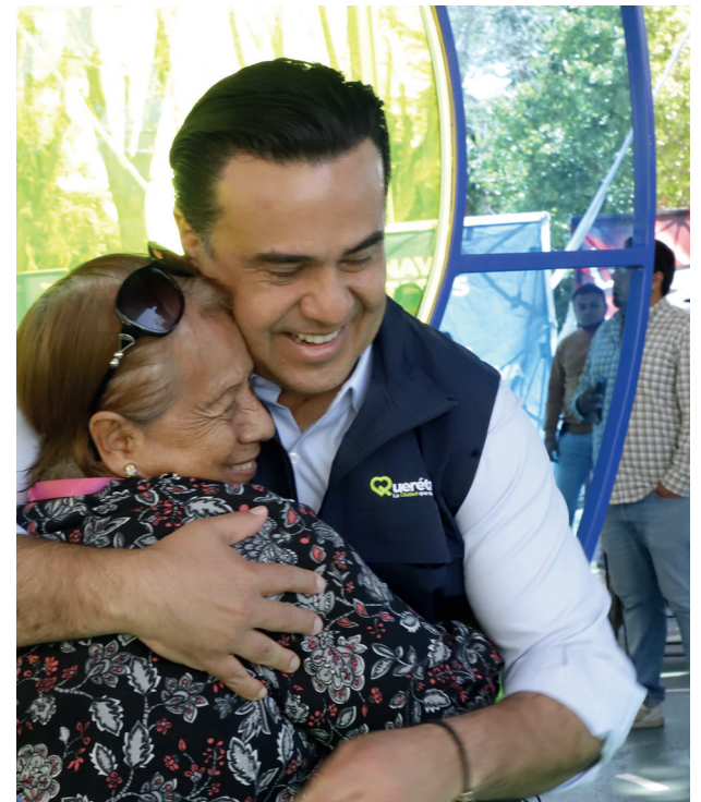
Evento: Se emprendieron programas de salud, bienestar y seguridad, durante su administración.

Finalmente, el Sistema Municipal DIF entregó despensas mensualmente a grupos de adultos mayores en las siete delegaciones, y se puso en marcha el programa Te Quiero Cálido, con el que tan solo en el último año se entregaron 30 mil cobijas a este sector.