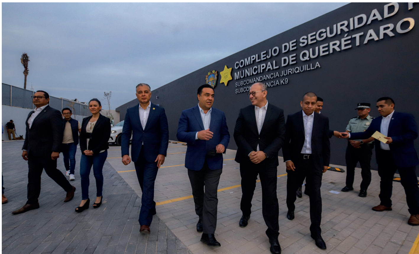
Evento: Varios programas de la administración de Luis Nava fueron replicados en otros estados.