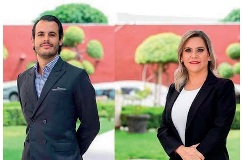
Evento: Se trata de Cristina Fernández de Cevallos y Hugo Lora

Los anteriores nombramientos fueron revelados dante la apertura de la “Casa de Transición” del alcalde electo, quien señaló que se trata de un espacio para mantener la cercanía.