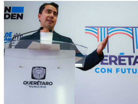
Evento: Una de nuestras grandes apuestas en obra social es la evolución del Parque Bicentenario