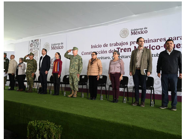
Evento: El gobernador, Mauricio Kuri, destacó el trabajo conjunto con la Federación.

Se espera que el recorrido en tren sea de una hora con 40 minutos, un ahorro significativo para los usuarios. Por su parte, el gobernador de Querétaro, Mauricio Kuri González, destacó el impacto que el tren tendrá en el estado, subrayando que abrirá nuevas oportunidades