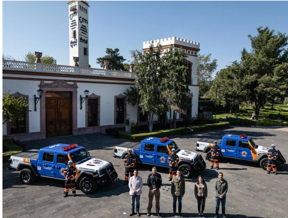
Evento: Se tuvo una inversión total de cinco millones 985 mil 600 pesos.

Los nuevos vehículos, equipados con tracción 4X4, permitirán a Protección