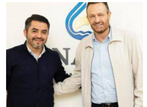
Evento: Tanto el mandatario estatal como el funcionario federal coincidieron en continuar con la suma de esfuerzos.

Tanto el mandatario estatal como el funcionario federal coincidieron en continuar con la suma de esfuerzos hasta