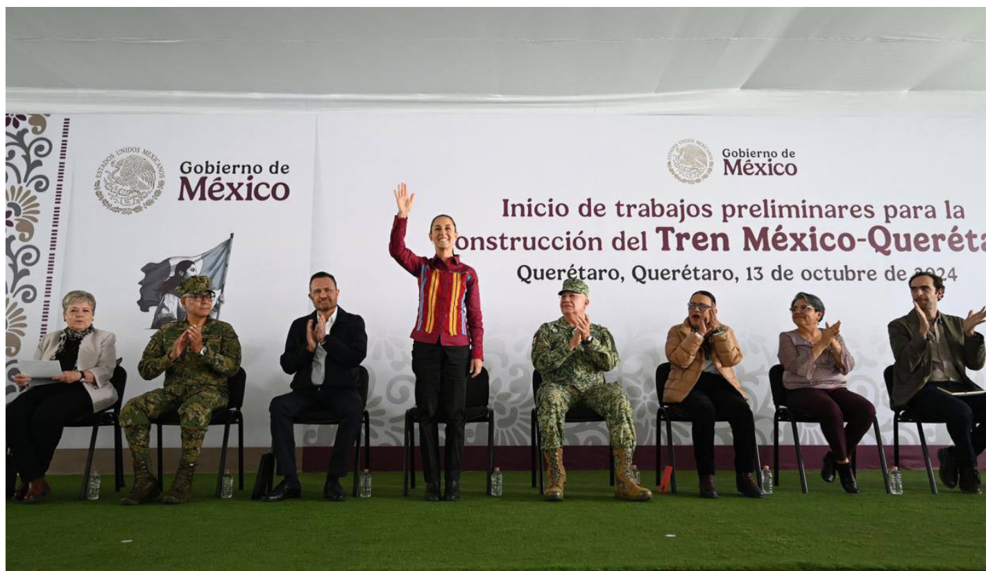
Evento: La presidenta de la República, Claudia Sheinbaum, estuvo en Hércules el pasado domingo.

La Presidenta de México, Claudia Sheinbaum Pardo, dio el banderazo de salida a los trabajos preliminares para la construcción del Tren México-Querétaro, durante su vista al deportivo La Purísima, en la zona de Hércules. Ahí, la mandataria destacó que este proyecto promete impulsar el desarrollo económico y mejorar la conectividad en la región, pues tendrá dos estaciones; una en la capital y otra en San Juan del Río.