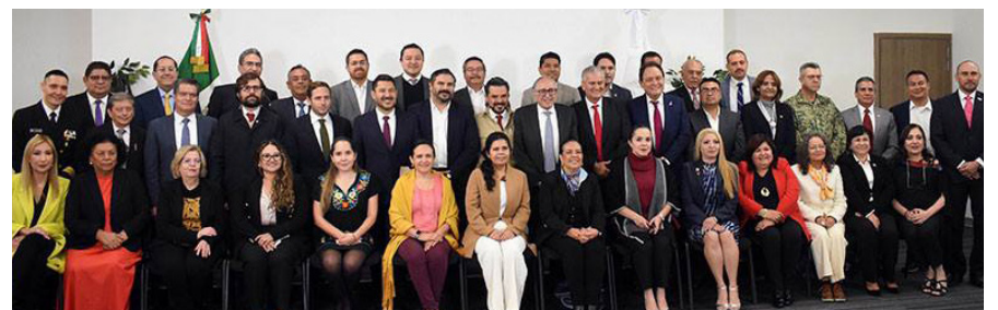
Evento: El propósito de estas acciones es homologar los procedimientos de diagnóstico y terapéuticos