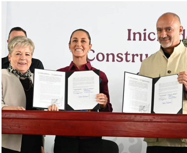
Evento: Se tendrán dos estaciones; una en la capital y otra en San Juan del Río.

El secretario de Infraestructura, Jesús Esteva Medina,