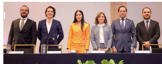
Evento: Se buscan atraer las inversiones a Corregidora.