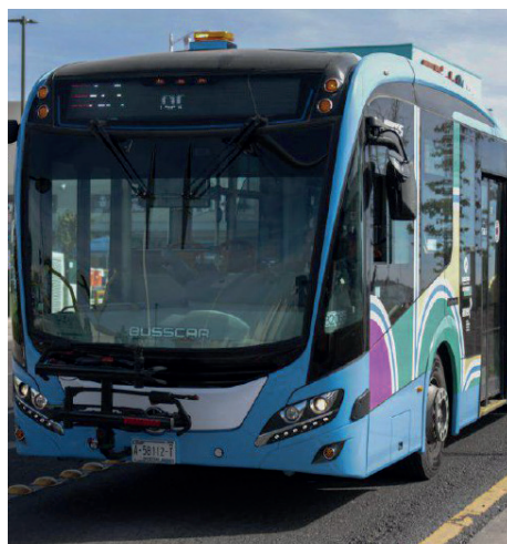
Evento: Se sumaron 14 nuevas unidades marca Mercedes Benz.

Cabe recordar que las y los usuarios del transporte público que utilizan la tarjeta de prepago Qrobús tienen acceso a tarifas preferentes, transbordo cero y seguro de viaje; asimismo, al registrar su tarjeta en la aplicación Qrobús pueden administrar su saldo y llevar un registro de sus viajes.