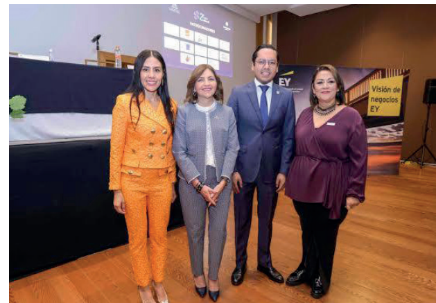
Evento: El alcalde destacó la importancia de la Reforma Laboral.