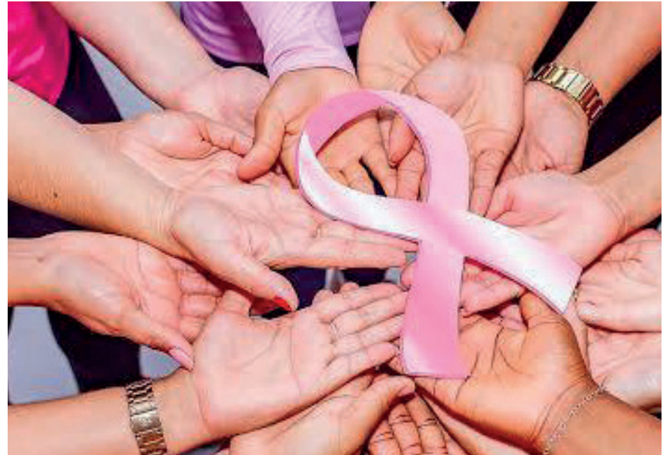
Evento: Se busca que las mujeres puedan detectar a tiempo este padecimiento.

Es importante destacar que, ante cualquier síntoma como hinchazón en senos, hoyuelos en la piel, dolor, retracción de pezones, enrojecimiento, secreción y ganglios linfáticos hinchados pueden comunicarse a los teléfonos 4428706071 de MUCCAM; y al 4461205636 de UNEME.