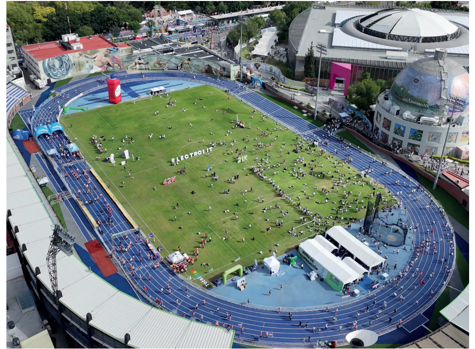
Evento: 11 mil ciudadanos salieron a las calles para presenciar el maratón 2024.

Las autoridades de seguridad y protección civil reportaron un saldo blanco, con atenciones menores a los corredores.