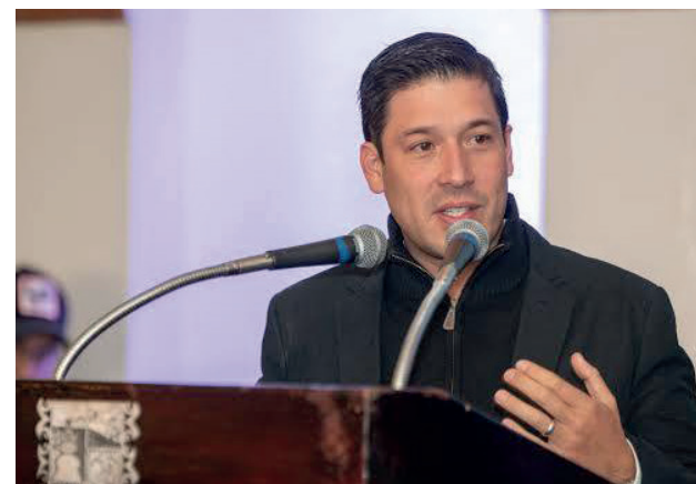
Evento: Seguridad, desarrollo y mejores oportunidades son algunas de sus propuestas.

Finalmente, el alcalde aseguró que la unidad entre el gobierno y la ciudadanía será una parte esencial para en conjunto crear un mejor municipio.