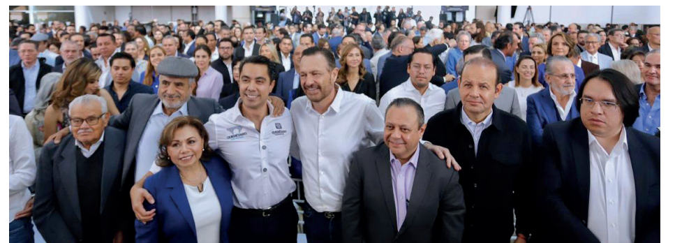
Evento: La ciudadanía definirá el Programa de Obra Anual.

Finalmente, como quinta acción, señaló el establecimiento del Centro de Atención Municipal (CAM) Norte. Ahí, las y los queretanos que viven en las zonas más alejadas del centro administrativo y económico de la ciudad, podrán realizar sus trámites y gestiones municipales de manera accesible y eficiente.