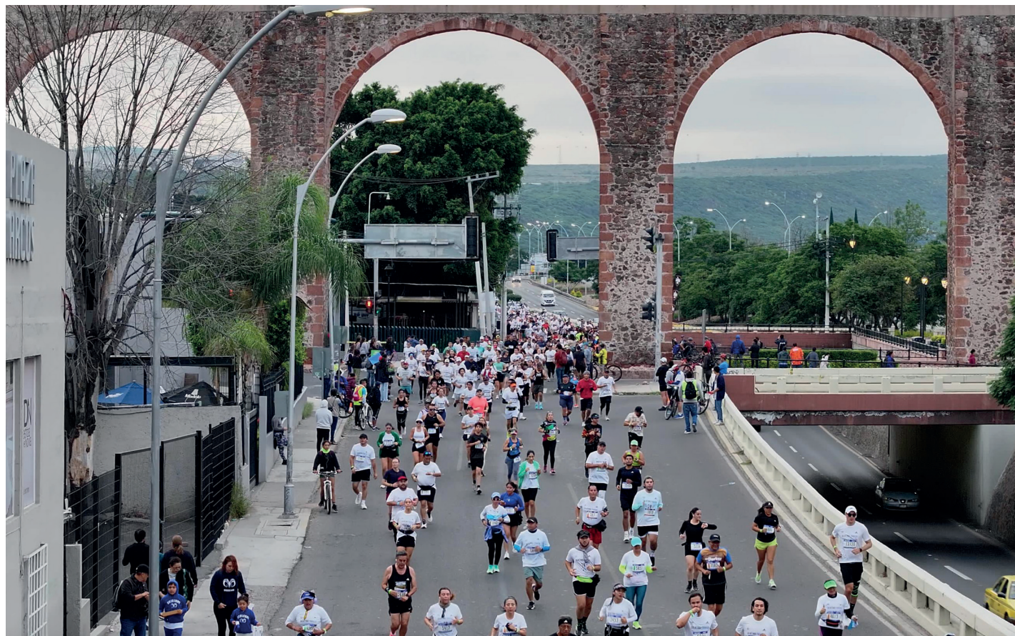
Evento: El evento contó con la participación de 20 mil corredores.

Las calles de Querétaro y Corregidora fueron sede de la fiesta deportiva más grande de la entidad con el Maratón 2024, el cual contó con la participación de 20 mil corredores y un total de 11 mil espectadores, quienes salieron a las calles a apoyar a los participantes.