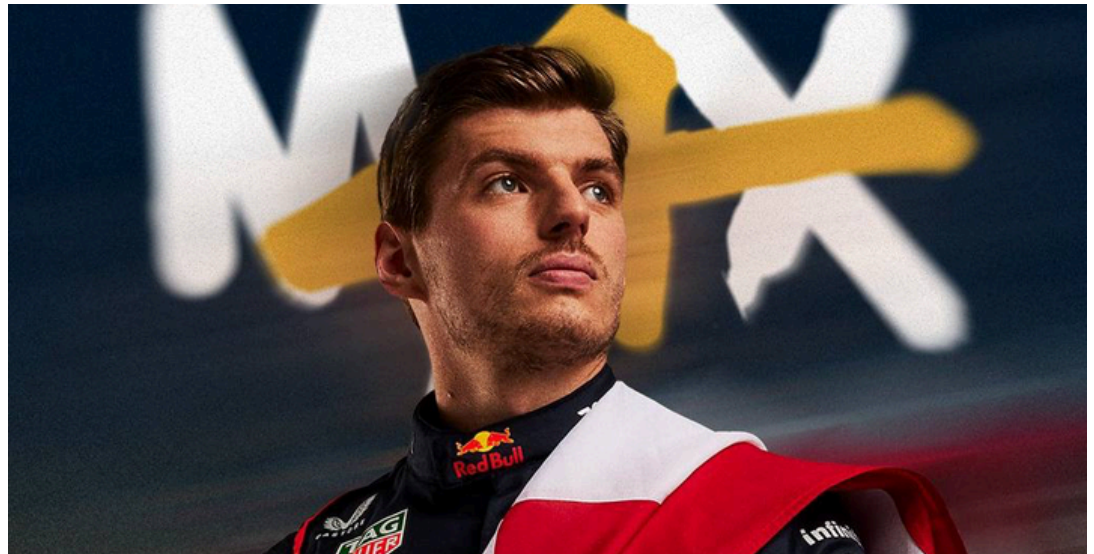
El neerlandés hizo historia en Las Vegas.

El neerlandés escribió su nombre en los libros de historia igualando al francés, Alain Prost, y al alemán, Sebastián Vettel con cuatro títulos conquistados, y, a sus apenas 26 años, no es imposible pensar que pueda llegar a los siete campeonatos, y empatar a Lewis Hamilton y Michael Schumacher.