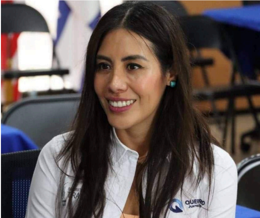
El año pasado solo 5 empresas no habían pagado, aunque se encontraban en el plazo.