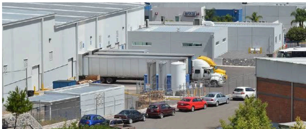
Las empresas deben adaptarse para enfrentar las condiciones que podrían surgir.

Muñoz Altamira señaló que, a nivel local, las empresas deben adaptarse para enfrentar las condiciones que podrían surgir; sin embargo, expresó confianza en que se mantendrá la colaboración con Estados Unidos y que se respetará el lugar de México como el principal socio comercial de la nación vecina.