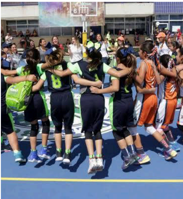
El evento se realiza del 4 al 12 de noviembre.

Con el objetivo de garantizar la seguridad y fluidez vial durante el Torneo de la Amistad, el Municipio de Querétaro implementará un operativo especial, en el que participan la Secretaría de Seguridad Pública, Protección Civil y la Secretaría de Este importante evento deportivo se desarrolla del 4 al 12 de noviembre en el Colegio Cumbres, y se espera la llegada de 50 mil asistentes.