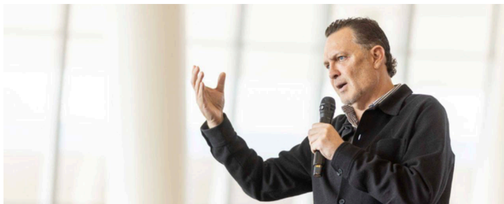
Mauricio Kuri refirió que México ofrece a Estados Unidos talento humano, logística y competitividad.

"Lo más importante es que México mande señales de certidumbre jurídica y de instituciones sólidas" concluyó el mandatario estatal.