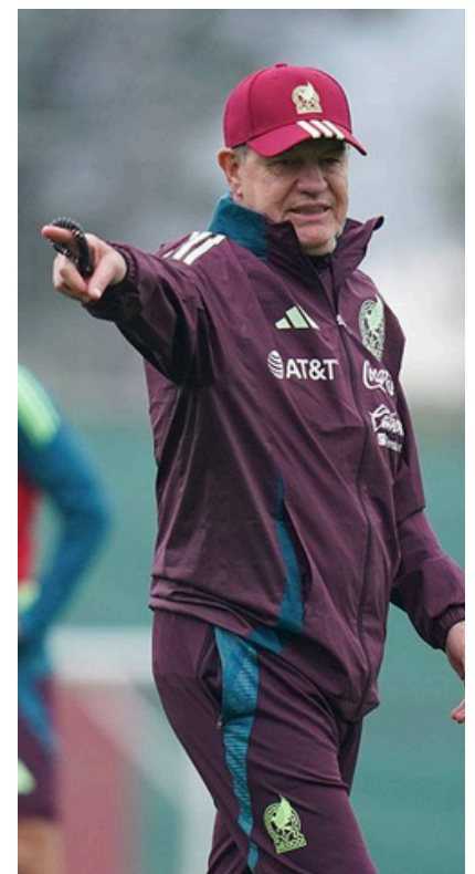
La selección se medirá ante Honduras en cuartos de final.

DELANTEROS: Los no militantes en Europa predominan en la delantera, pues solamente Raúl Jiménez y Julián Quiñones son refuerzos del viejo continente, mientras que Henry Martín y Ángel Sepúlveda, Alexis Vega, Ozziel Herrera, Diego Lainez, César Huerta y Guillermo Martínez, forman parte de la Liga MX.