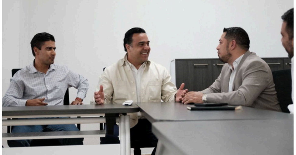
Durante las reuniones se analizaron las condiciones de cada municipio.

Durante las reuniones se analizaron las condiciones de cada municipio, y se estableció como prioridad la atención a servicios básicos como son el acceso al agua potable, implementación y modernización del sistema de drenaje