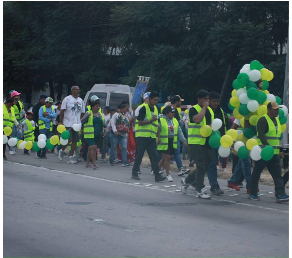
Evento: Se espera que las peregrinaciones continúen a lo largo de este lunes.