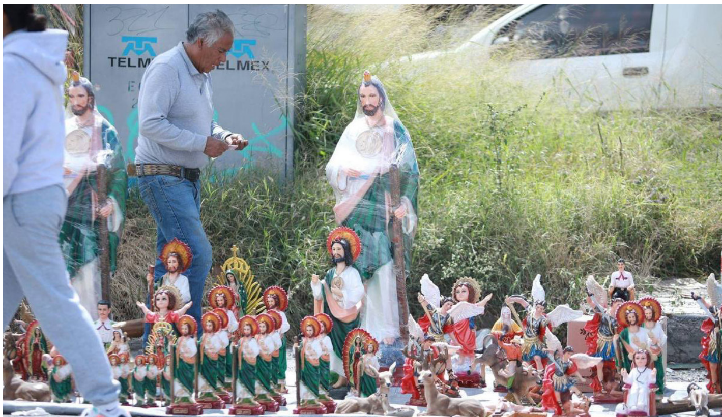
Evento: Se realizó un operativo para garantizar la seguridad de los asistentes.

La celebración, que ha cobrado cada vez más relevancia en Querétaro, atrajo a familias enteras, quienes llevaron ofrendas, veladoras y figuras del santo para ser bendecidas.