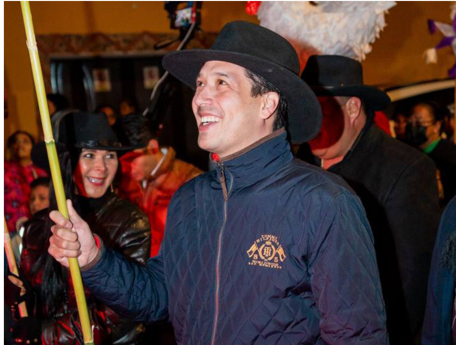
Evento: Se vivió un ambiente de fiesta y tradiciones.

Ahí se vivió un ambiente de fiesta y tradiciones entre toda la población, al