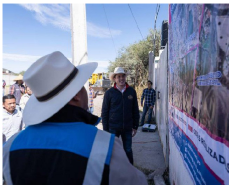
Evento: Realizó recorridos para iniciar y entregar obras en San Vicente Ferrer y Santa María Begoña.

guarniciones, mil 293 metros cuadrados de pavimento ahogado en mortero, 300 metros cuadrados de concreto estampado, instalación de 100 tomas domiciliarias, 17 pozos de visita, tubería y 100 registros sanitarios. Para dichos trabajos se destinarán siete millones 636 mil 629 pesos en beneficio de mil 819 habitantes.