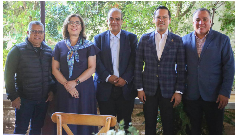
Evento: El objetivo de esta iniciativa es compartir prácticas exitosas en temas de desarrollo.