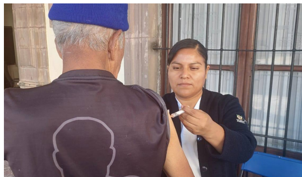
Evento: Es importante ponerse la vacuna, para prevenir.

No obstante, en personas con enfermedades cróni-