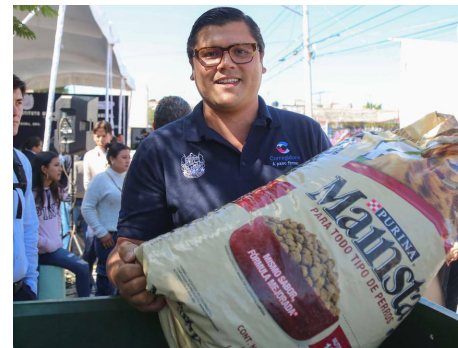
Evento: También arrancó el Croquetón Corregidora 2024 donde se recibirán donativos de alimento para perros y gatos.

de alimento para perros y gatos, con la meta de recolectar 15 toneladas. Los contenedores están ubicados en las instalaciones del Centro de Atención Municipal (CAM), CAM Candiles, así como en el nuevo Instituto Municipal del Cuidado Animal,