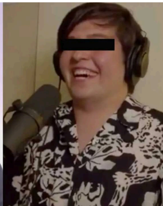
El Influencer podría alcanzar hasta 40 años de cárcel.